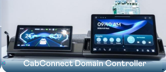
CabConnect Domain Controller