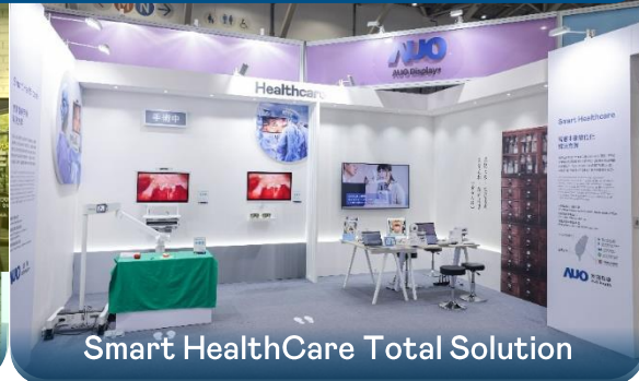
Smart HealthCare Total Solution