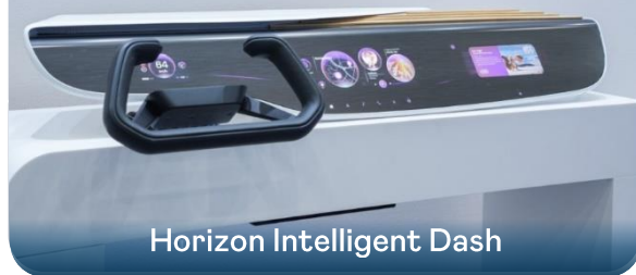
Horizon Intelligent Dash