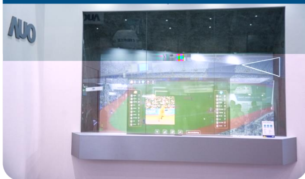
64-inch Sports AR Solution